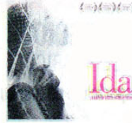
La locandina del film di stasera al Cristallo

Anna è una giovane orfana cresciuta tra le mura del convento dove sta per farsi suora. Poco prima di prendere i voti scopre di avere una parente ancora in vita, Wanda, la sorella di sua madre. L'incontro tra le due donne segna l'inizio di un viaggio alla ricerca dei segreti del loro passato. Anna scopre di essere ebrea e di chiamarsi Ida. La rivelazione sulle sue origini la spinge a cercare le proprie radici, per trovarsi a scegliere tra la religione che l'ha salvata durante l'occupazione nazista e la sua ritrovata identità. Info: ☎ 0522.431697; www.cinematocristallo.it ; biglietto 5 euro