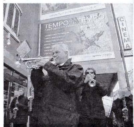
Anche la banda all'inaugurazione del cinema

e gli studenti per l'utilizzo della nuova sala cinematografica i cui lavori di ristrutturazione sono costati circa 200mila euro. Ieri dopo l'inaugurazione per tutta la giornata si sono succeduti una serie di eventi gratuiti per grandi e piccini, che sono culminati con la proiezione in anteprima del film d'animazione per adulti